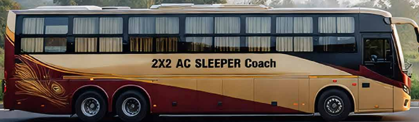
2X2 AC SLEEPER Coach